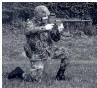
* Anschlag kniend freihändig