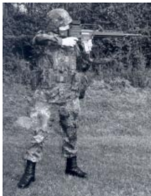
** Anschlag stehend freihändig